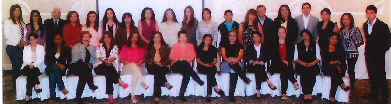
I CONGRESO NACIONAL "EL ROL DE LAS SECRETARIAS EN ÉPOCA DE CAMBIOS" Quito, del 23 al 25 de septiembre de 2015